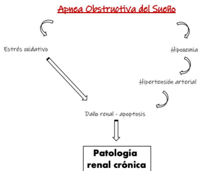
Fig.2: Mecanismos de influencia de SAOS en la patología renal crónica.

A menudo, los pacientes de diálisis manifiestan fatiga y excesiva somnolencia diurna cuando se les pregunta mediante cuestionarios, sin embargo, Chu et al. no encontraron correlación entre TRS y las respuestas de los cuestionarios sobre estos aspectos 3 . Los autores creen que esto puede ser debido a que el paciente con patología renal crónica, habitualmente se presenta cansado, por lo que es probable que lo achaque a su patología renal y no al TRS que pueda presentar.